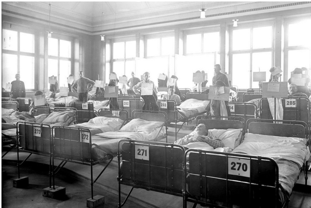
▲ Ospedale militare a Olten nel 1918.

Fra il 1918 e il 1919, l'epidemia di "influenza spagnola" causò una delle più gravi crisi sanitarie della storia umana. La situazione oggi non è paragonabile a quella di un secolo fa. Eppure alcune analogie ci sono.