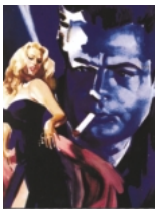
La Dolce Vita